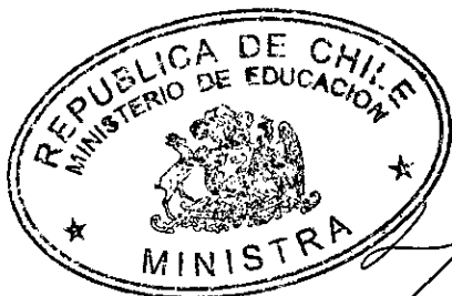
Marcela Cubillos Sigall MARCELA CUBILLOS SIGALL MINISTRA DE EDUCACIÓN

"POR ORDEN DEL PRESIDENTE DE LA REPÚBLICA"